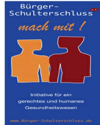
Bild anklicken, Antrag herunterladen, ausdrucken, ausfüllen und abschicken.

----- Informationen zur Gesundheitspolitik: www.Bürger-Schulterschluss.de .